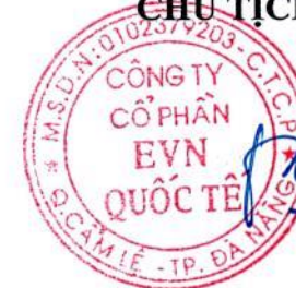
TRƯƠNG QUANG MINH