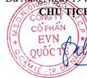
TRƯƠNG QUANG MINH