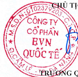
TRƯƠNG QUANG MINH